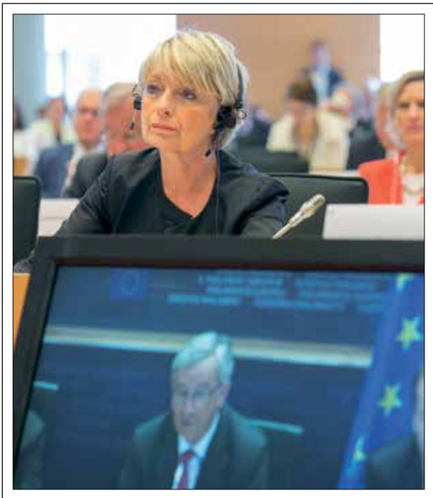
Audition de Jean-Claude Juncker, nouveau Président de la Commission européenne