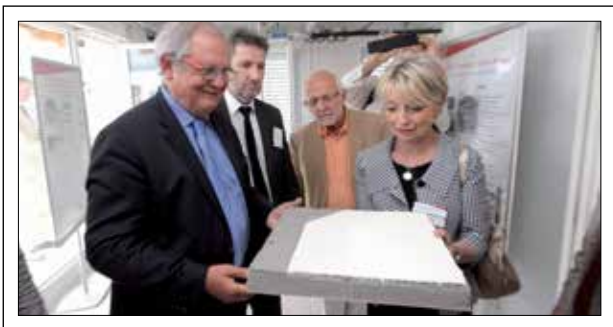
Inauguration du projet PAREX.IT au Bourget-du-Lac en Savoie