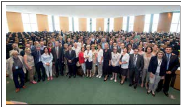
Rentrée studieuse en commission Environnement, santé publique et sécurité alimentaire