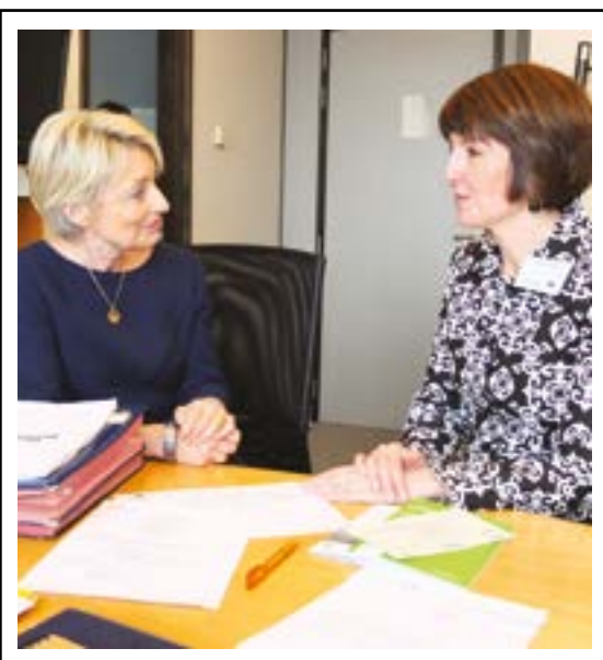
Discussion passionnée avec la Sénatrice américaine Cathy McMorris Rodgers, étoile montante des Républicains