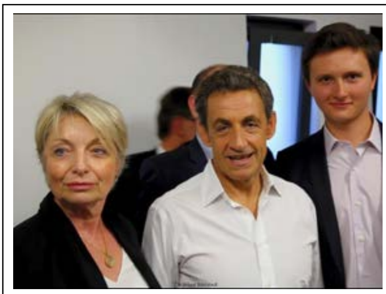
Avec Nicolas Sarkozy lors de son meeting à Rillieux-la-Pape et en compagnie du RDJ du Rhône Bastien Joint