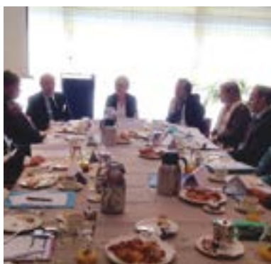
Table-ronde sur la Relation Client